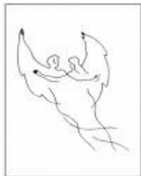
Simon András grafikája

A szerelem a két nem közötti testi-lelki kapcsolat, közösség. Alapja a kölcsönös pszichikai-biológiai vonzalom. Az igazi szerelem „első lépés” a helyes párválasztás felé vezető úton és feltétele a jó házasságnak. Jellemzője az adni akarás, a mások iránti tisztelet, megbecsülés, felelősségérzet. A szerelem igénye a teljesség, a teljes önátadás, amelybe beletartozik nemcsak a jelen, hanem a múlt elfogadása és a jövő építése is.