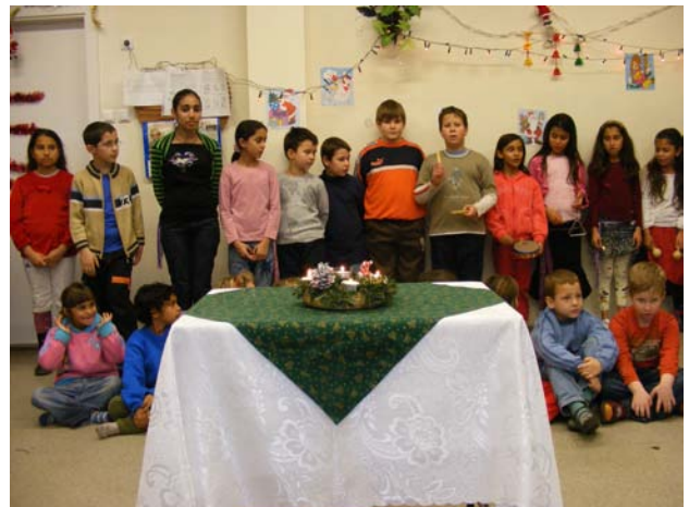
Karácsony a napköziben