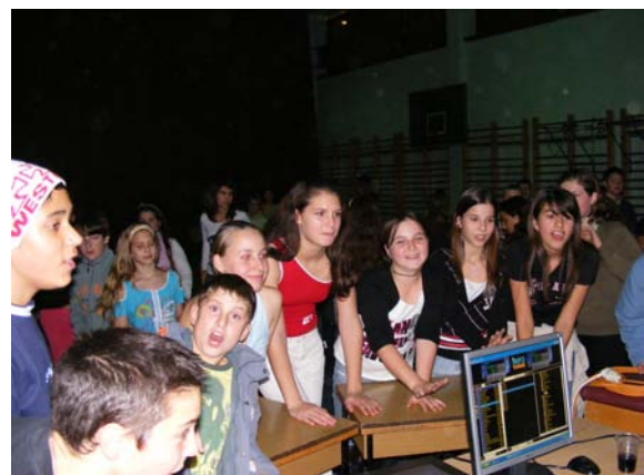
A novemberi suli-buli

☞ Továbbra is folytatódik a szövegértés verseny. Minden felsőst szeretettel várunk minden hónap első szerdáján a magyar teremben!