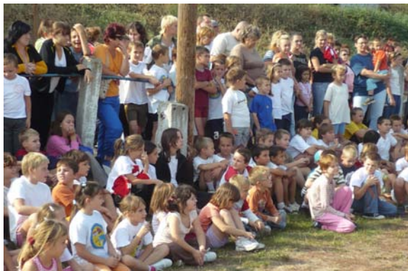
Készülődés a versenyre...