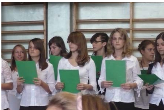
A nyolcadikosok műsora

Október 22-én iskolai keretek között emlékeztünk meg az 1956-os forradalomról. Köszönjük a színvonalas műsort!