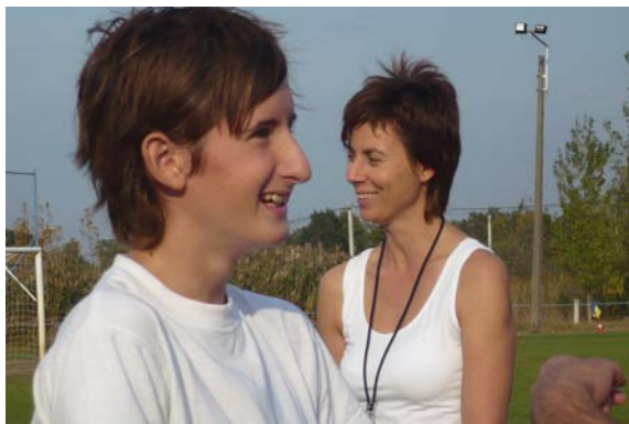
...és a végeredmény