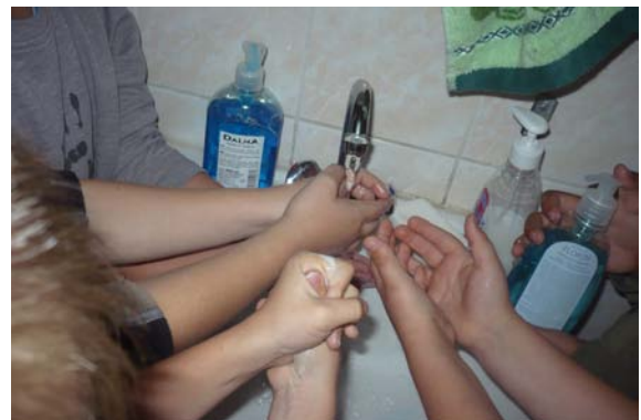
A nagy kézmosás

Október 15-én megérkezett az Amway képviselője, szappanokat, ajándékokat hozott. Így megkezdődhetett a NAGY KÉZMOSÁS!!!