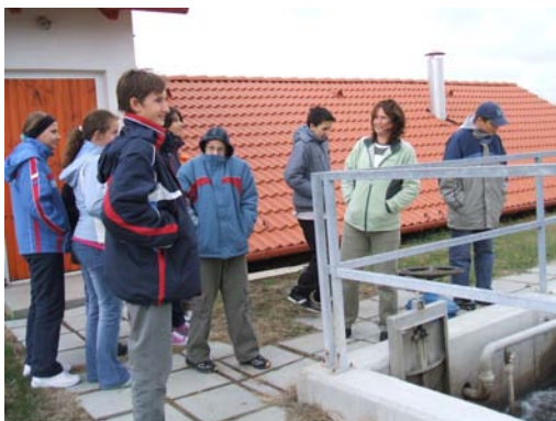
Ez nem egy titkos társaság! Iskolánkban kutatócsoport alakult. A kis csapat a helyi szennyvíztelepen vizsgálódott. Következő számunkban szívesen beszámolnánk az eredményekről!