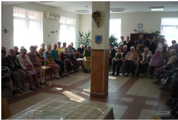
...és a közönség