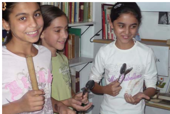
Ez jó mulatság!