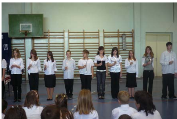
Gyertyagyújtás az áldozatok emlékére