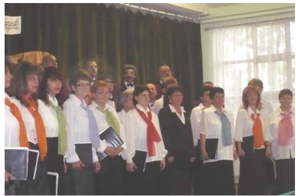
A Tiszaföldvári Pedagógus Női Kar és barátai október 17-én szenzációs hangversenyt tartottak a Művelődési Házban