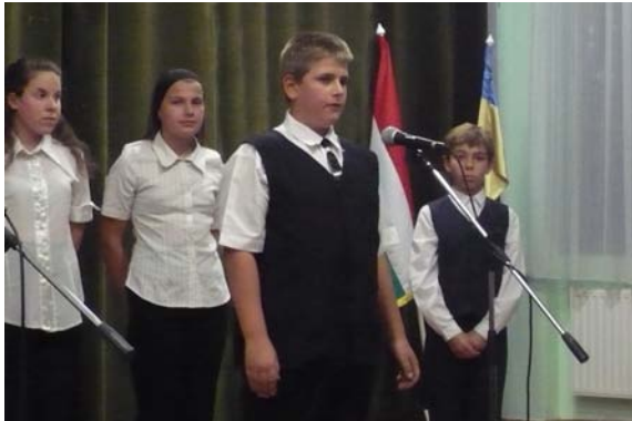
A műsor a Művelődési Házban kezdődött...

☺ Az október 6-i városi megemlékezést az idén iskolánk tanulói tartották. Köszönjük a felkészítő tanárok és a diákok munkáját!