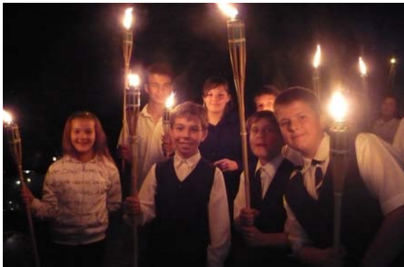
...fáklyás felvonulással és koszorúzással zárult