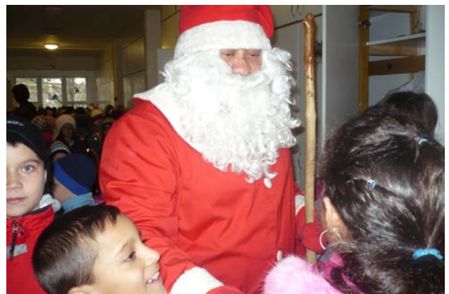
A Mikulásnak mindenki örült!

☺ December 6-án iskolánkban is járt a Mikulás. Minden osztályba ellátogatott.