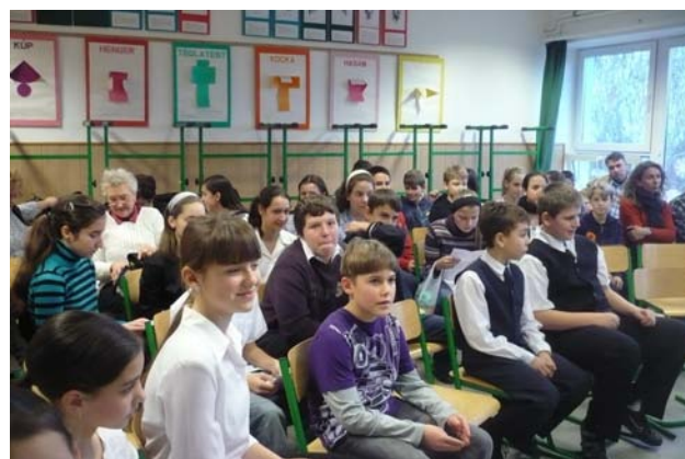
A felsős szavalóverseny résztvevői és közönsége

Minden résztvevőnek gratulálunk! A helyezést elért gyerekekkel találkozhatunk január 22-én a városi szavalóversenyen Homokon!