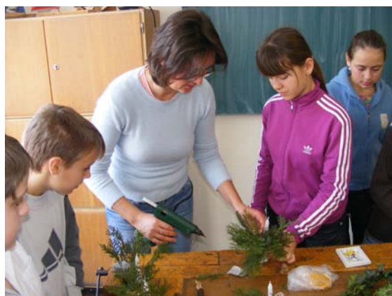
A karácsonyi játszóház