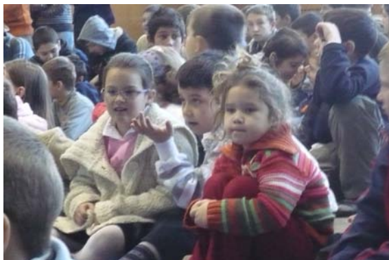
A nézők egy csoportja