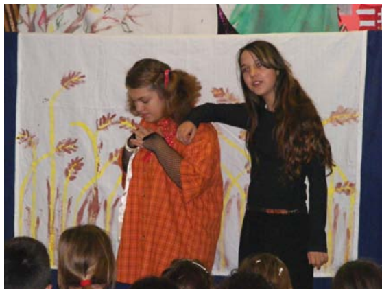
A báb- és dráma szakkör előadása

☺ November 11-én rendezték meg iskolánkban a Márton napi játszóházat, ahol bábjáték, kézműves játszóház, táncház várta az érdeklődő gyerekeket.