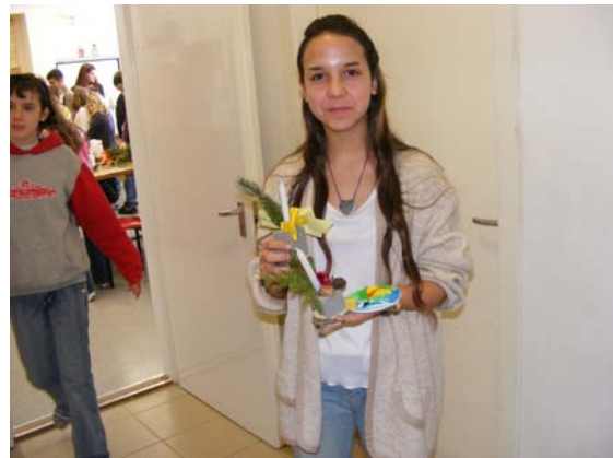
Kész az ajándék!

☺ December 6-án iskolánkban is járt a Mikulás. Minden osztályba ellátogatott.