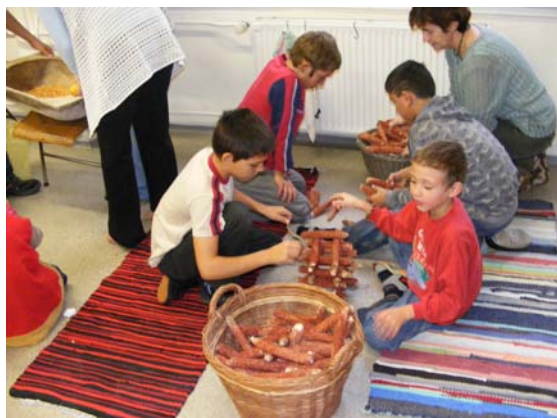
"Csutkajenga" építése a játszóházban

☺ Október 31-én a Szilver Táncsoport Egyesület szervezésében táncversenyt tartottak, ahol iskolánk számos tanulója is részt vett. Sajnos az eredményekről nem tudunk, de biztosan sikeresek voltak, mint mindig.