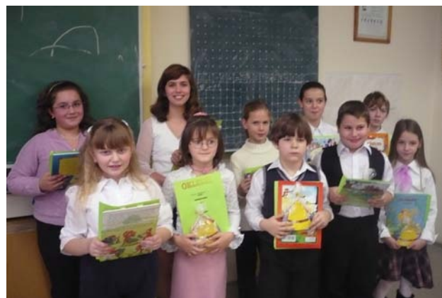
Az alsós szavalóverseny győztesei